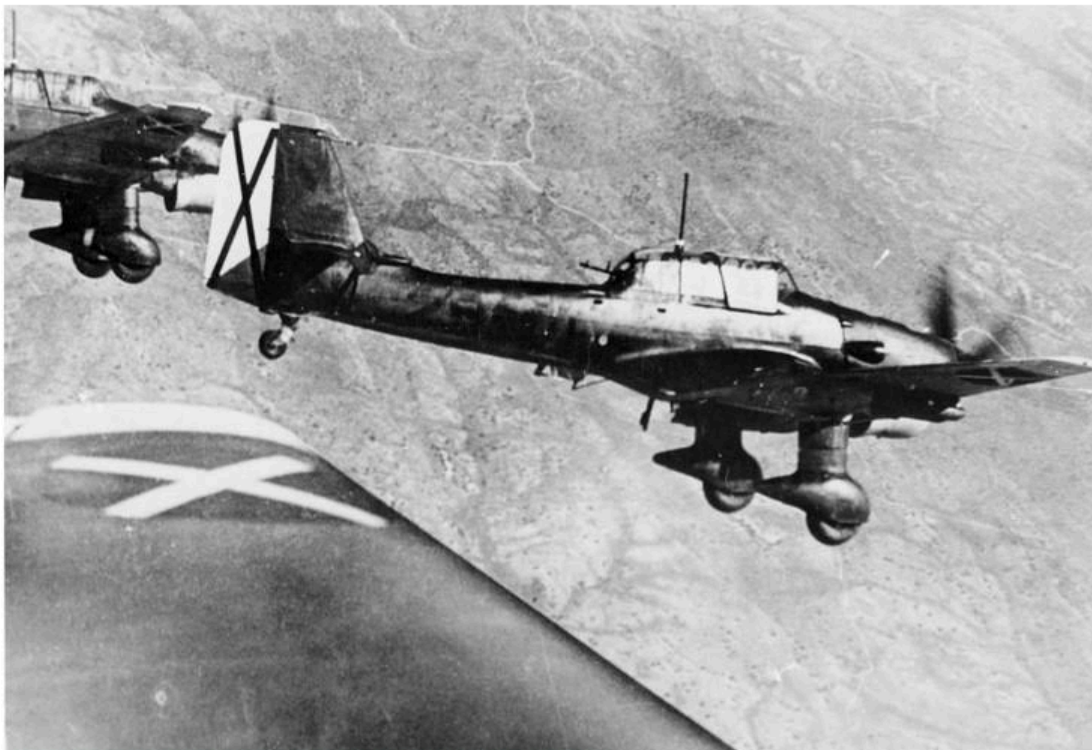
Ju 87B Stuka i bruk under den spanske borgerkrigen

L'autoria d'aquest segon bombardeig tampoc no genera dubtes si es tenen a mà els documents que resumeixen les operacions del dia esmentades abans: "JU 87, dos aviones bombardean el puente al W. de Martorell". 17