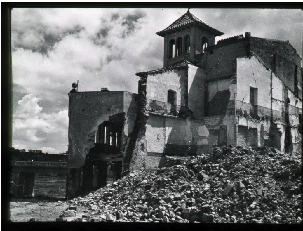
Edifici de la Vila en runes després del bombardeig.

A continuació, el recompte d'edificis afectats per carrers que mostra l'expedient. Els que van ser "totalment destruïts" es pot deduir que ho van ser per l'impacte directe de les bombes; els afectats parcialment, per l'onada expansiva.