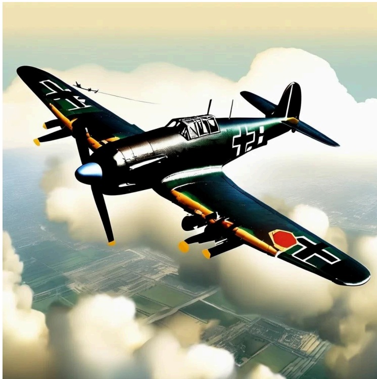
Bombarder Junkers Ju 87 (Stuka) generat amb intel·ligència artificial.

La Junta de Defensa Passiva de Catalunya va subvencionar la martorellenca amb 30.000 PTA. La resta de recursos van provenir de la imposició d'una quota setmanal obligatòria de 25 cèntims a cada família de la població i de l'increment de 25 cèntims en el preu de les entrades dels espectacles.